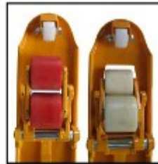
Tandem-Lastrollen PU od. Nylon mit Einfahrrolle