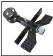
Feststellbremse zum Nachrüsten