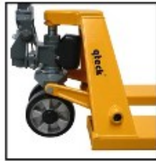
Wartungsarme Hydraulik mit externem Ausgleichsbehälter