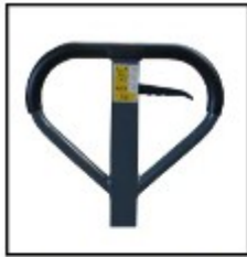
Stabile Deichsel mit 3 Funktionen (heben-neutral-senken)