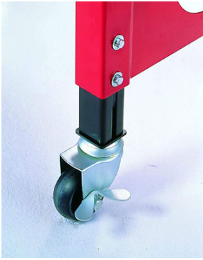
VARIABLE TISCHHÖHE Einstellbar von 780mm - 950mm.